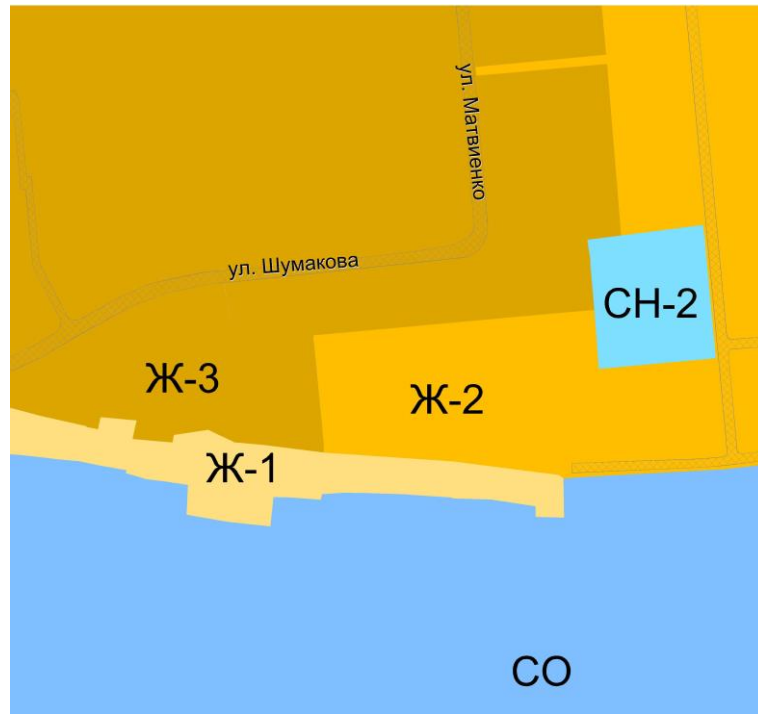
Рис.2 Фрагмент карты градостроительного зонирования после изменения