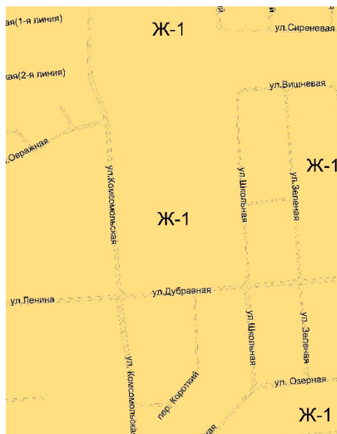
Рис.2 Фрагмент карты градостроительного зонирования после изменения

2. В статье 32 Градостроительные регламенты территории города Лермонтова в таблицах 1, 2, 3, 5 для вида разрешенного земельного участка «Блокированная жилая застройка (2.3)» установить следующие предельные минимальные и (или) максимальные размеры земельных участков, в том числе их площадь, кв.м: