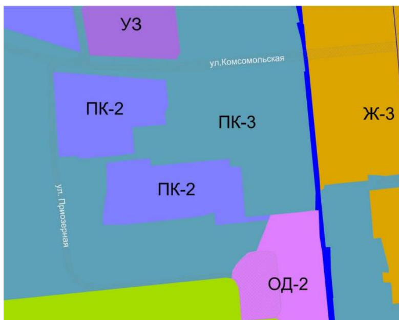
Рис. 2 Фрагмент карты градостроительного зонирования после изменения