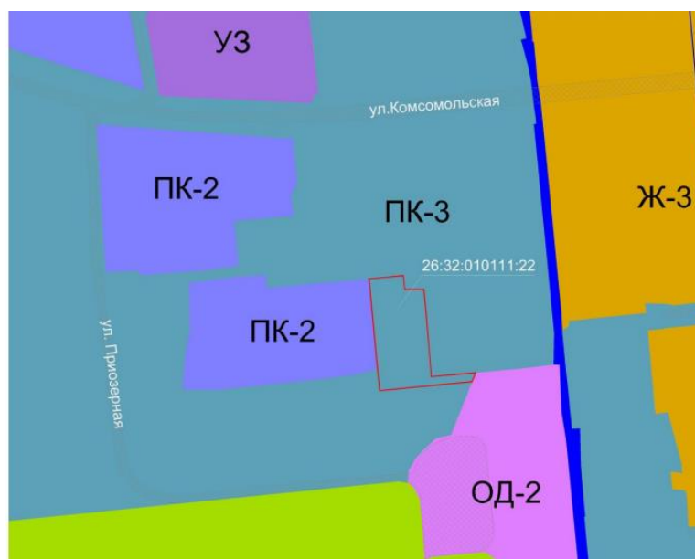
Рис. 1 Фрагмент карты градостроительного зонирования до изменения

1. В статье 23 «Карта градостроительного зонирования» и в статье 24 «Карта зон с особыми условиями использования территории города Лермонтова» Правил часть территориальной зоны ПК-3 Зона производственно-коммунальная с предприятиями, сооружениями и иными объектами V класса вредности по санитарной классификации предприятий, сооружений и иных объектов в границах земельного участка с кадастровым номером 26:32:010111:22, местоположение которого: Ставропольский край, города Лермонтов, улица Комсомольская, 13, изменить на территориальную зону ПК-2 Зона производственно-коммунальная с предприятиями, сооружениями и иными объектами III-IV-V класса вредности по санитарной классификации предприятий, сооружений и иных объектов согласно приведенному графическому описанию (рис. 1 - 2).