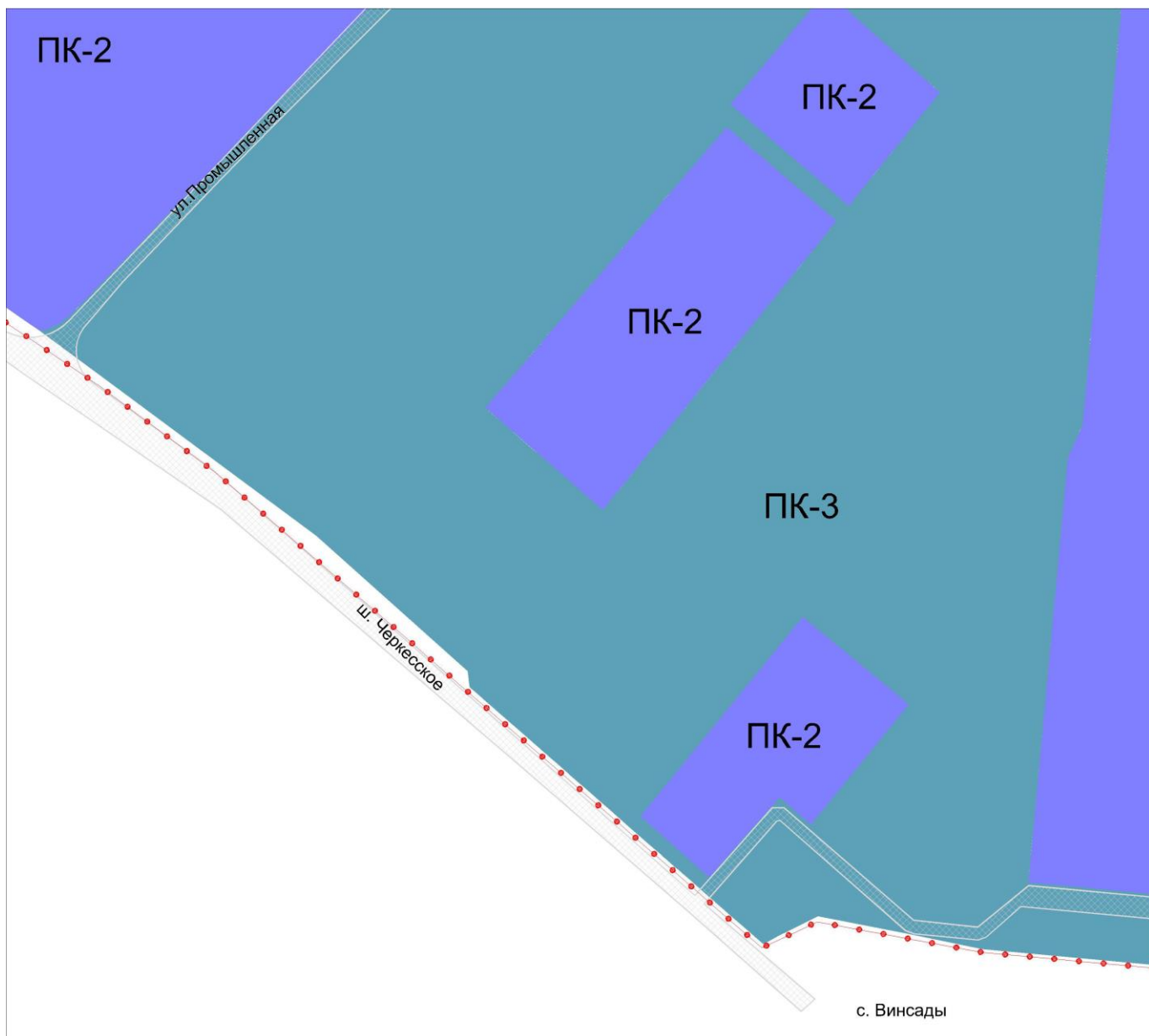
Рис. 2 Фрагмент карты градостроительного зонирования города Лермонтова после изменения