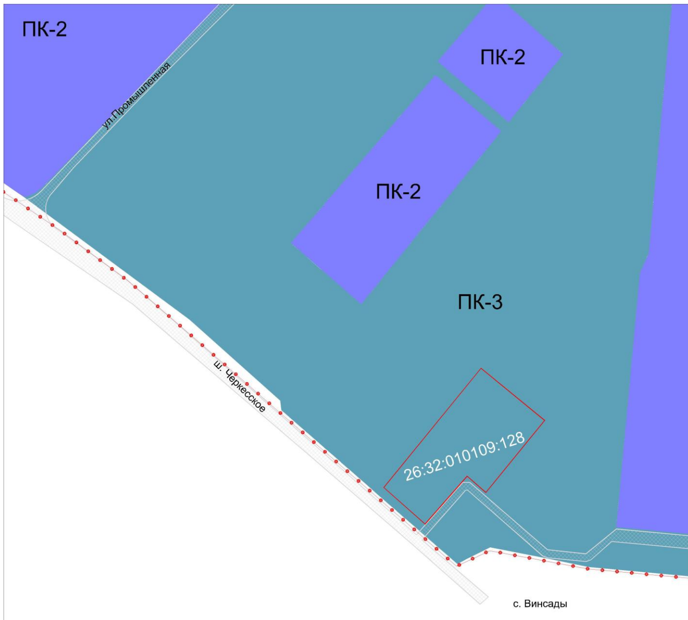
Рис. 1 Фрагмент карты градостроительного зонирования города Лермонтова до изменения