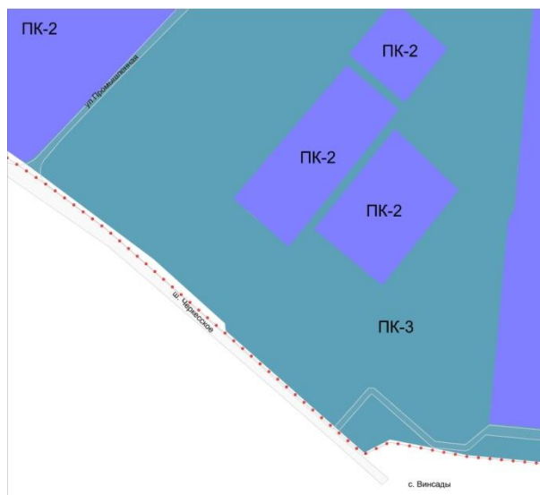
Рис. 2 Фрагмент Карты градостроительного зонирования города Лермонтова после изменения

2. Контроль за выполнением настоящего решения возложить на постоянную комиссию Совета города Лермонтова по промышленности, энергетике и строительству.