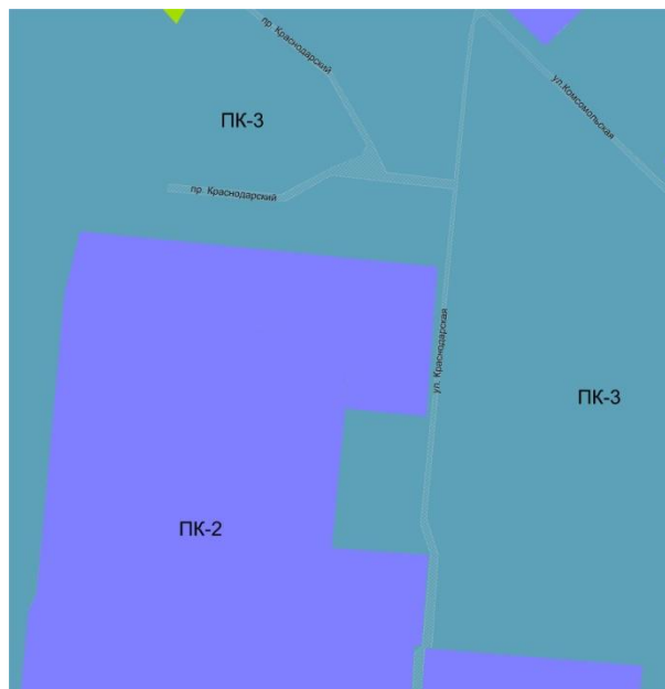
Рис. 2 Фрагмент карты градостроительного зонирования города Лермонтова после изменения

2. Контроль за выполнением настоящего решения возложить на постоянную комиссию Совета города Лермонтова по промышленности, энергетике и строительству.