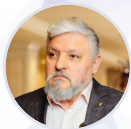
Игорь Бухаров Президент Федерации Рестораторов и ОТЕЛЬЕРОВ России