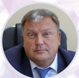
Сергей Калитин Министр промышленности и торговли Приморского края