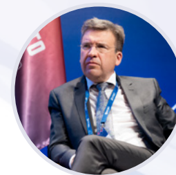
Владлен Максимов Президент Ассоциации малоформатной торговли России