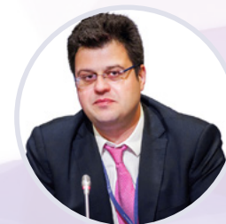
Никита Кузнецов Директор Департамента развития внутренней торговли Минпромторга России