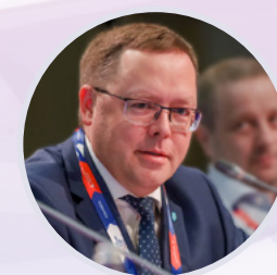
Андрей Карпов Председатель правления Российской Ассоциации экспертов рынка ритейла