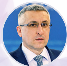
Андрей Бронц Министр сельского хозяйства Приморского края