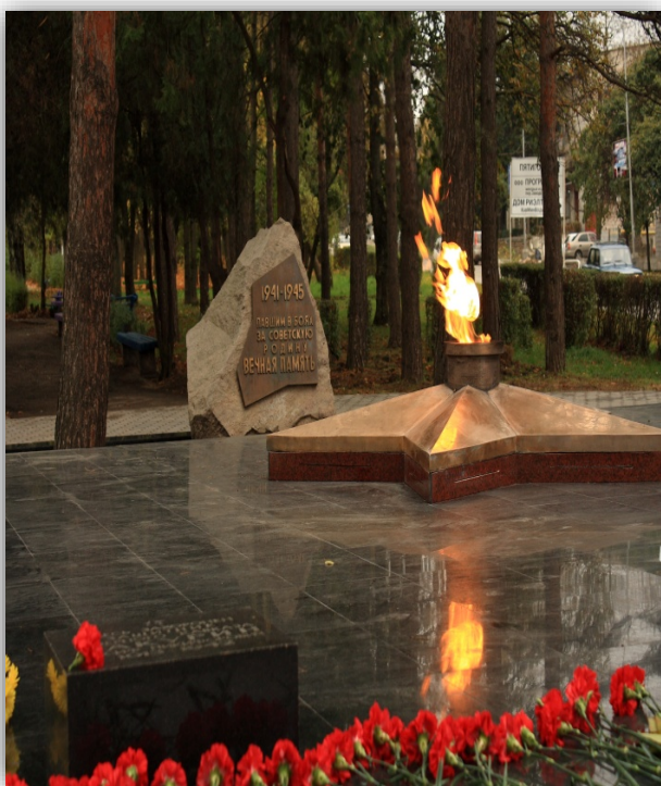
Мемориал «Вечный Огонь»

На территории города Лермонтова находятся 23 объекта культурного наследия: 22 – регионального значения и 1 – выявленный объект культурного наследия. По видам это: 2 памятника искусства, 4 – истории и 17 – археологии, которые в соответствии с Федеральным законом от 25.06.2002 № 73-ФЗ «Об объектах культурного наследия (памятниках истории и культуры) народов Российской Федерации» подлежат государственной охране.