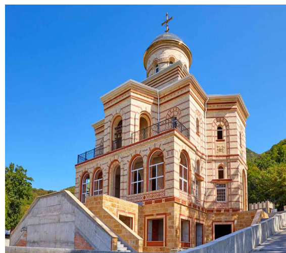
Соборный храм в честь Успения Пресвятой Богородицы

В 2021 году завершено строительство соборного храма Успения Пресвятой Богородицы в византийском стиле, строительство началось в апреле 2014 года. Общая площадь собора составляет 500 кв. метров. Стены храма облицованы ракушечником и терракотовым туфом, высота которых составляет 28 метров