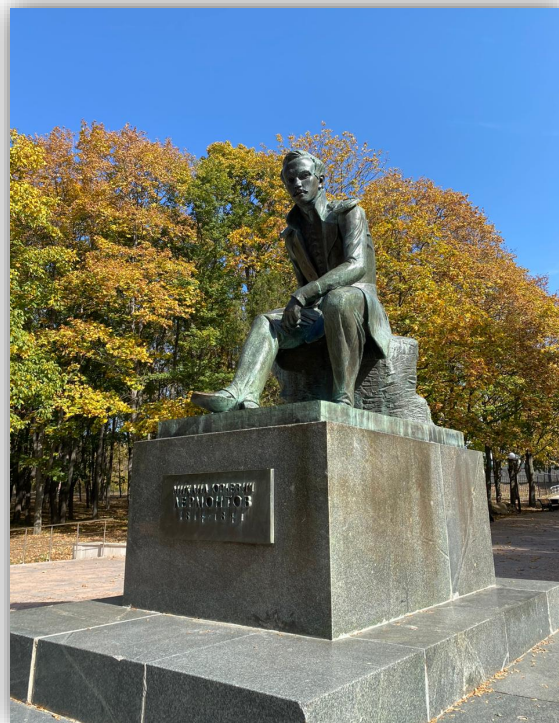
Памятник М. Ю. Лермонтову