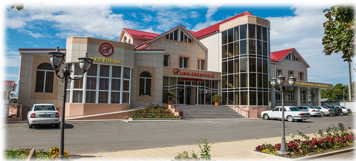
Гостиничный комплекс «Николаевский»

В городе Лермонтове работает 3 гостиницы: гостиничный комплекс «Николаевский», гостевой дом «Арагат», гостиница «Спорт».