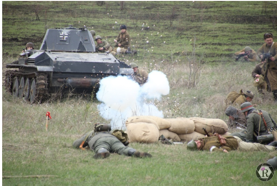
Фестиваль исторической реконструкции «Битва за Кавказ»

Проводятся показательные выступления войск национальной гвардии Российской Федерации и выступление военного оркестра штаба Северо-Кавказского округа войск национальной гвардии Российской Федерации, историческая реконструкция сражений за Кавказ с привлечением военной техники времен Великой Отечественной войны: советский танк Т-70; автомобиль ГАЗ-67; мотоциклы К-750; немецкий танк Pz.II; автомобиль Stoewer; выставка современных образцов боевой техники и оружия, угощения полевой кухни.