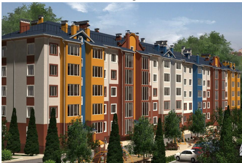
Жилой комплекс «Маскарад»

В последние годы происходит оживление жилищного строительства в городе Лермонтове.