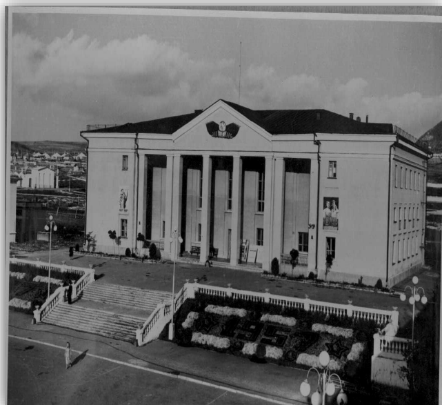
Дворец культуры им. С. М. Кирова