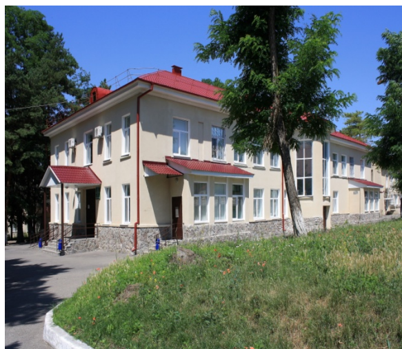
Клиническая больница № 101

Структурными подразделениями больницы являются: отделение скорой и неотложной медицинской помощи, стоматологическое отделение, патологоанатомическое отделение центральное стерилизационное отделение, взрослая поликлиника на 360 посещений в смену, детская поликлиника на 90 посещений в смену, Центр восстановительного лечения в составе ЛПУ, Центр крови.