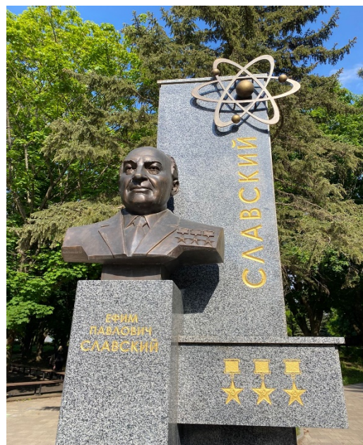
Монумент Е.П. Славскому