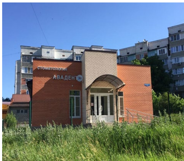
Стоматологическая клиника «Авадент»