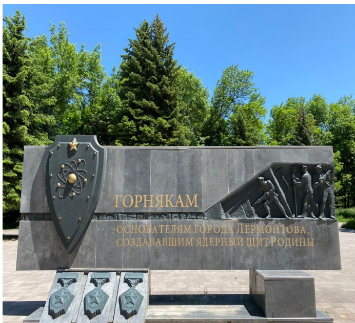
Обелиск шахтерам – основателям города Лермонтова