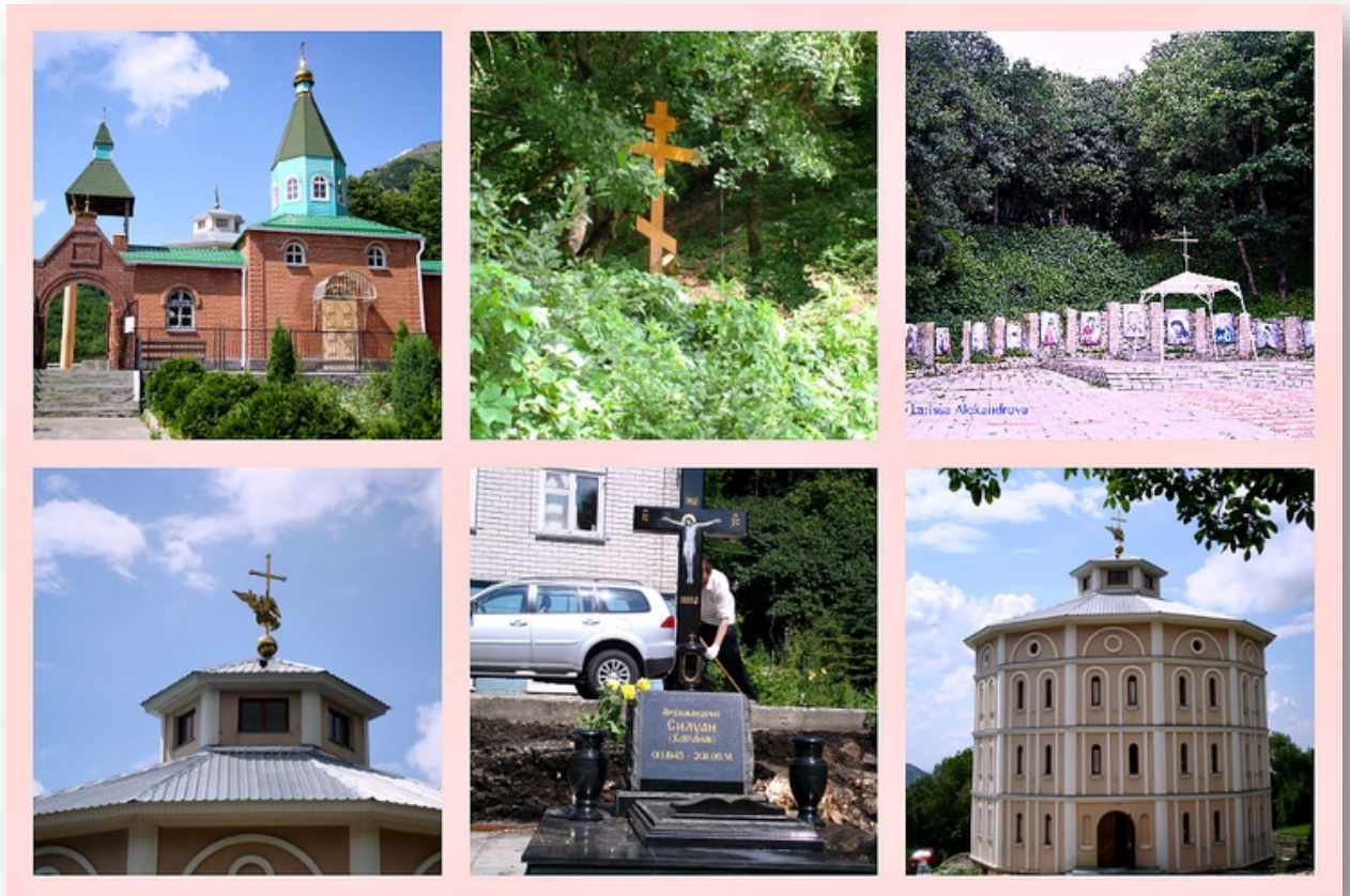
Второафонский Бештаугорский мужской монастырь

Бештаугорский Второафонский мужской монастырь расположен на территории города Лермонтова в живописном месте на юго-западном склоне горы Бештау – самой высокой вершине Кавказских Минеральных Вод. Второафонский монастырь был основан русскими монахами, выходцами из Старого Афона, на том месте, где по преданию, в IX веке существовал византийский монастырь.