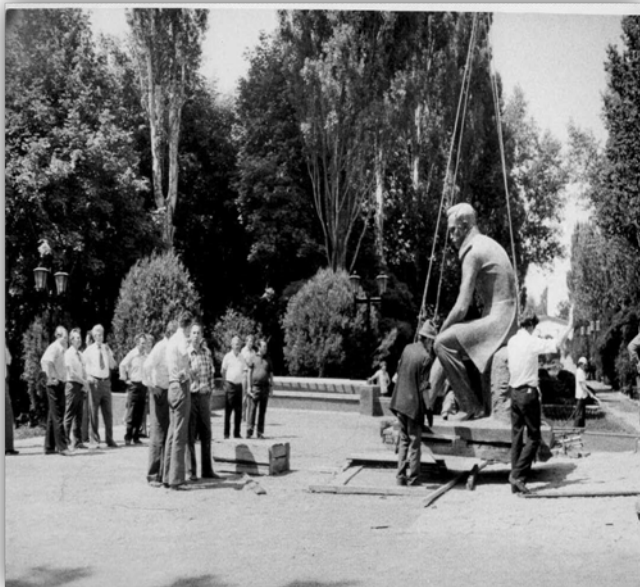
Установка памятника М. Ю. Лермонтову

Город строился по всем правилам советской градостроительной политики. Комплексность застройки, благоустроенность жилья, развитая сеть культурно-просветительных, образовательных, бытовых учреждений давали основание считать новый населенный пункт образцом социалистического города. Именно так – «Соцгород» обычно называли свой «Населенный пункт рудоуправления № 10» его первые жители. В 1954 году появилось наименование – поселок Лермонтовский. Быстрое его развитие, интенсивное строительство и благоустройство способствовали тому, что Указом Президиума Верховного Совета СССР 24 июня 1956 года поселку определен статус города. Горожанам нравилось называть его «город Лермонтов», и спустя несколько лет это имя было официально закреплено новым Указом Президиума Верховного Совета. Памятник великому поэту, чье имя носит город, был открыт в городском парке в 1981 году (скульптор О. К. Комов, архитекторы Н. А. Ковальчук и Ю. Г. Пьянков).